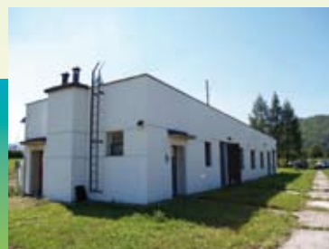
chlórovacia stanica Fačkov