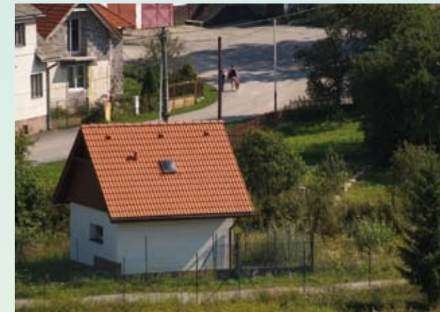
vodárenský zdroj Lietava - Morské oko