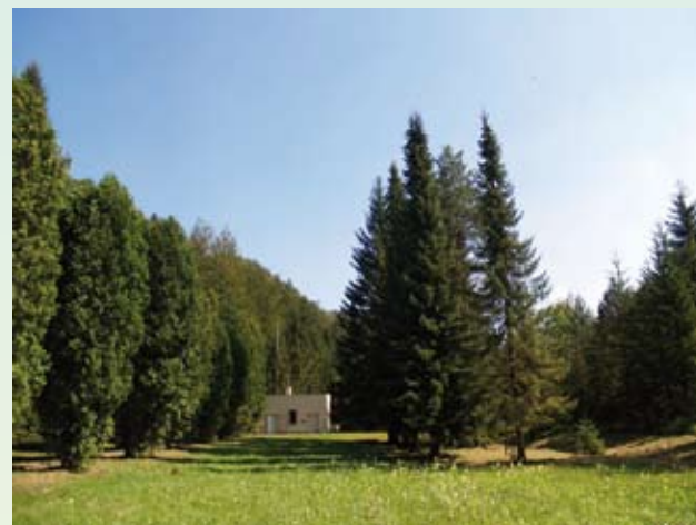
vodárenský zdroj Lietavská Svinná - Patúch