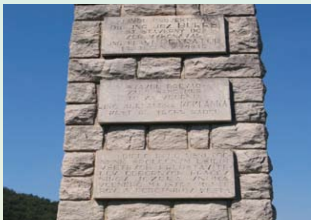
vodárenský zdroj Turie, pamätník staviteľom Tretieho vodovodu