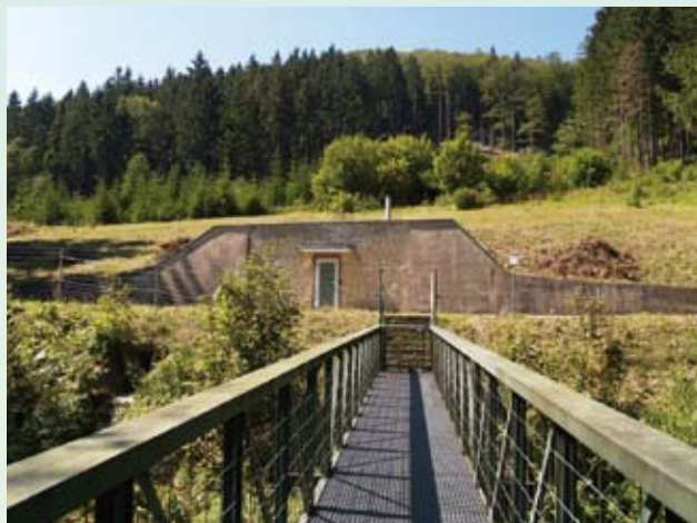
vodárenský zdroj Fačkov - Ráztoky