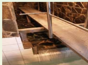
vodárenský zdroj Fačkov - Ráztoky