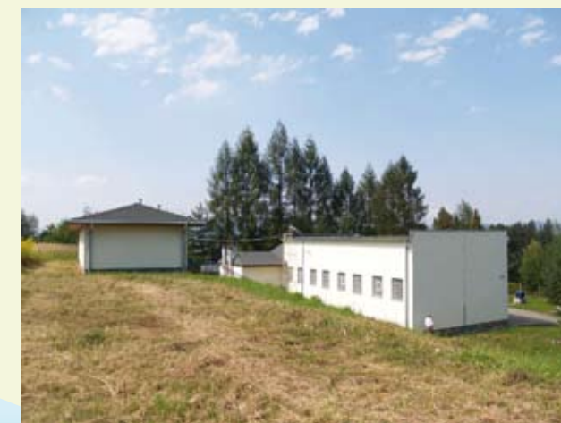
vodojem Žilina - Chrašť