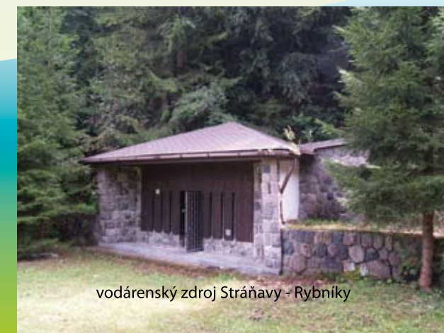
vodárenský zdroj Stráňavy - Rybníky